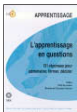
L'apprentissage en questions. 131 réponses pour administrer, former, décider.

Ces deux ouvrages seront vendus respectivement aux prix de 75 F et 235 F dans les librairies des CRDP et CDDP. Le guide portant sur l'apprentissage sera mis à jour par la suite sur le site web du CNRAA.