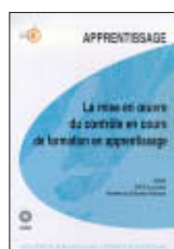
La mise en œuvre du contrôle en cours de formation

Les missions des corps d'inspection en apprentissage (3 ème partie). Ce guide sera diffusé gratuitement et sera disponible au téléchargement sur le site du CNRAA.